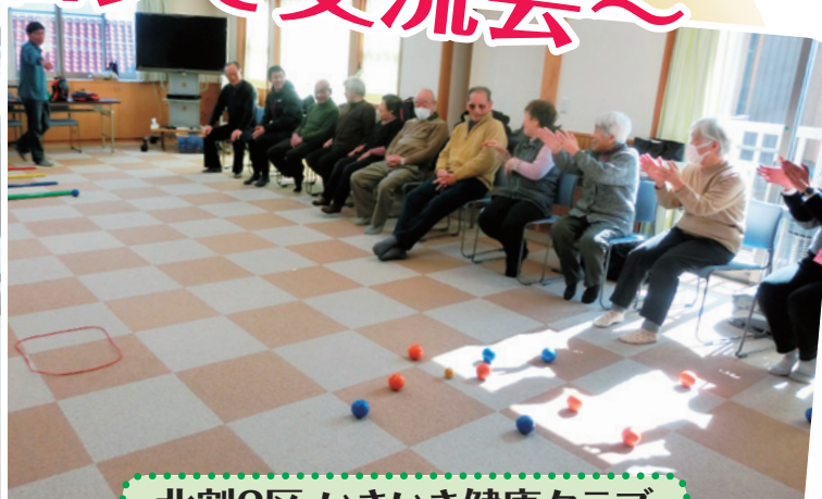
北割2区 いきいき健康クラブ