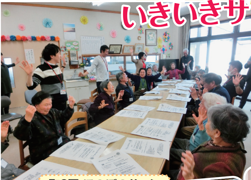
町2区 ほのぼのサロン