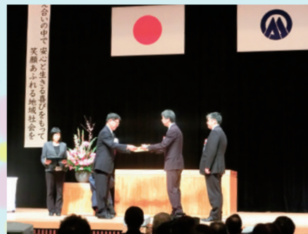
昨年度の大会より