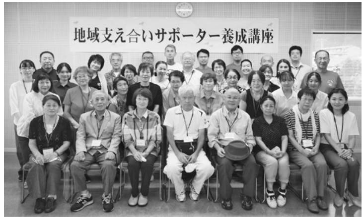
〈養成講座修了した皆様と、講師の地球人ネットワークinこまがねの皆様〉